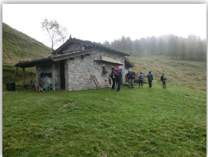
Baita Foldone – (escursione 22/10/2015)

Ritrovo: ore 7:00 via Sottocorna ( presepe)