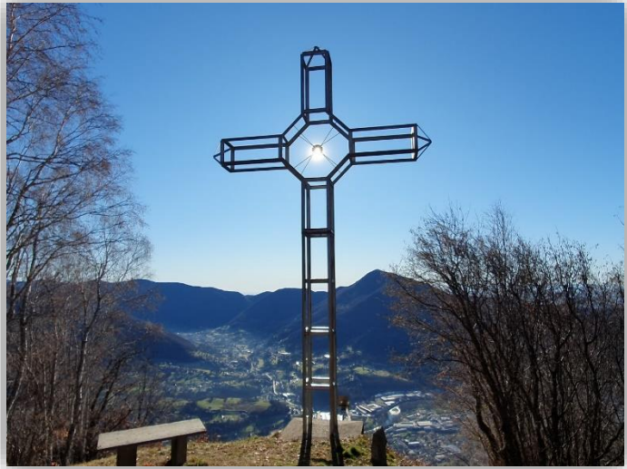
Croce di San Luigi (m 960)

Da: Chiesetta Santa Maria Comenduno (m 350) Sentiero n° 9 (nuovo itinerario GS Marinelli) ↑ Cappella degli alpini ↑ Ol Signur (m 410) Sentiero n 7 ↑ Madonna del Narciso (m 732) ↑ Baita Cortè ↑ Croce di San Luigi (m 960) Sentiero dei soldati ↑ Valle di Rena (m 1046) Sentiero del Crusì ↓ Crus de Corla (m 905) ↓ Santuario Madonna di Petello (m 653) ↓ Grotta di Petello ↓ sentiero Agostino Noris ↓ sentiero n° 3 Via S. Giuseppe ↓ Comenduno Dislivello totale: m.735 Lungh. Km 7,4 Tempi indicativo: intero giro h. 4÷5 ore circa Difficoltà: E (escursionistico) Ritrovo: ore 7:00 via Sottocorna ( presepe)