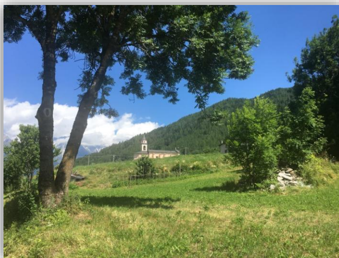
Santicolo Frazione di Corteno Golgi

ore 13:25 o 14:00 o 15:15 costo ticket € 3,50