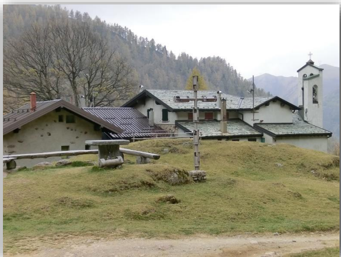
Rifugio Madonna della Neve (escursione 2/11/2017)