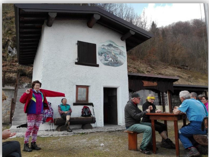
Bivacco La Plana (escursione 07/04/2016)

Da: Chignolo d'Oneta (m 828) Sentiero CAI 526 (Andata e Ritorno) ↑ Bivio per santuario del Frassino (m 876) ↑ Bivacco La Plana (m 1239) Ritorno: su stesso sentiero ↓ Chignolo Finale con pranzo in trattoria "Da Renata" Facoltativo: (Prima o dopo pranzo) Breve e facile passeggiata verso San Rocco fino alla frazione Ortei (m 788) Dislivello totale: m 600 Lungh. Km 6,5 Tempi indicativi: andata e ritorno ore 3:00 Difficoltà: E (escursionistico) Ritrovo: ore 7.00 (Villa Regina P.)