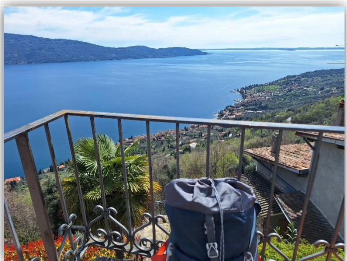
BVG - 3ª tappa (Escursione del 27 marzo 2025)

Da: Gragnano Parcheggio di Via dei Ruc (m 90) Segnavia 30 (Via Crocefisso) ↑ Muslone (m 465 - 1h15')h ↑ Piovere (m 417 - 50' tot 2h) ↑ Cascate di Piovere (m 500) ↑ Aer (m 571- 1h tot. 3h) ↑ Gardola Tignale - 1h tot 4h) Facoltativa*: Discesa al lago su sentiero Sospeso tra dirupi in località "Pra de la Fam" Dislivelli: +m 941 -m 479 Lungh. Km 12 Tempi indicativi.: solo andata ore 4 Difficoltà: E (escursionismo) Ritrovo: ore 6:30 via Sottocorna (presepe) Nota: Ritorno a gragnano con autobus costo 2€ ÷ 4€ durata 20 min (* Se si prosegue per "Pra de la Fam" aggiungere 1h30' e 500 dislivello