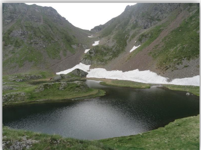
Laghetto di Ponte Ranica inf (Esc 13/07/2013)

Da: Piani dell'Avaro (m 1680) ↑ Bivio CAI 109 inizio anello (m 1818) ↑ Baitel (m1918) ↑ incrocio CAI101 (m 2080) → Laghetti di Ponteranica inf e sup (m 2110) ↑ Passo di Triomen (m 2200) ↓ Colletto del Monte Avaro (m 2073) ↓ Bivio CAI 109 Chiusura Anello (m 1818) ↓ Piani dell'Avaro Dislivello totale: m 604 Lungh. Km 7,7 Tempi indicativi: (intero giro) ore 4 circa Difficoltà: E (escursionistico) Ritrovo: ore 6:00 via Sottocorna (presepe) Strada per monte Avaro con ticket € 3,00