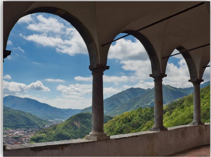
Santuario di Sant Patrizio – (escursione 19/05/2019)

Ritrovo: ore 7:00 via Sottocorna ( presepe)