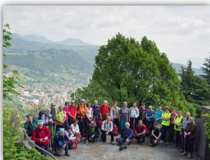
Castello di San Vigilio (escursione del 13/05/2019)