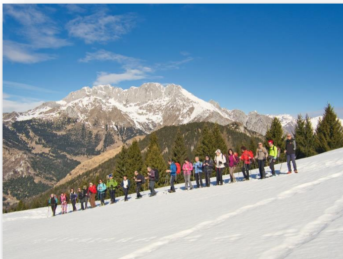
Colle Lantana (escursione 21/02/2020)

Ritrovo: ore 7:00 via Sottocorna ( presepe)