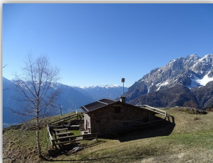
Bivacco Adamone (m 1459)

Ritrovo: ore 6:30 via Sottocorna (presepe)