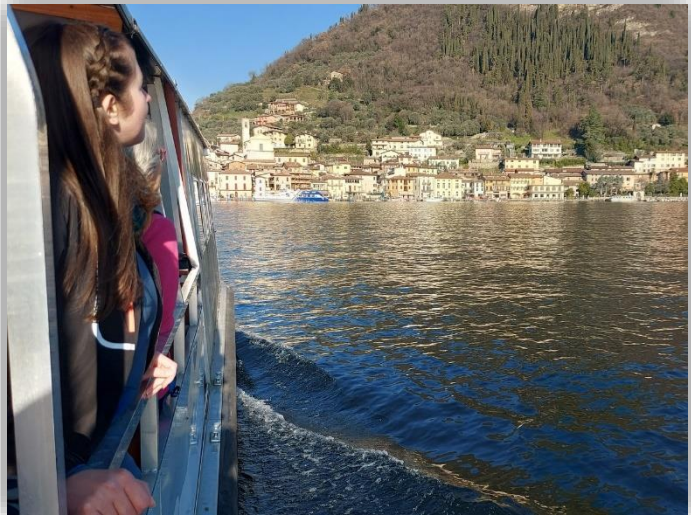
Sul traghetto per Monte Isola (Escurs.ne 06/03/2025)

Da: Peschiera Maraglio (m 189) Raggiungibile con traghetto da Sulzano → Sensole ↑ Menzino (m 250) → Sinchignano → Siviano → Carzano → Peschiera Maraglio Variante con salita al Sant. Mad.della Ceriola Da Carzano ↑ Olzano (m 339) ↑ Masse (m 400) ↑ Cure ↑ Sant. Madonna della Ceriola (m 588) ↓ Cure (m 461) ↓ Peschiera Maraglio Dislivello totale: m 87 Lungh. Km 8,8 Dislivello con variante: m 975 Lungh. Km 13,8 Tempi indicativo: h. 3.00 con variante h 5.00 Difficoltà: E (escursionistico) Ritrovo: ore 7:00 via Sottocorna ( presepe)