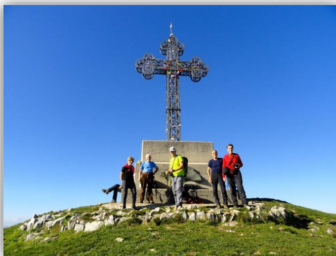
Monte Cornizzolo (escursione 05/11/2015)

Ritrovo: ore 6:00 via Sottocorna ( presepe)