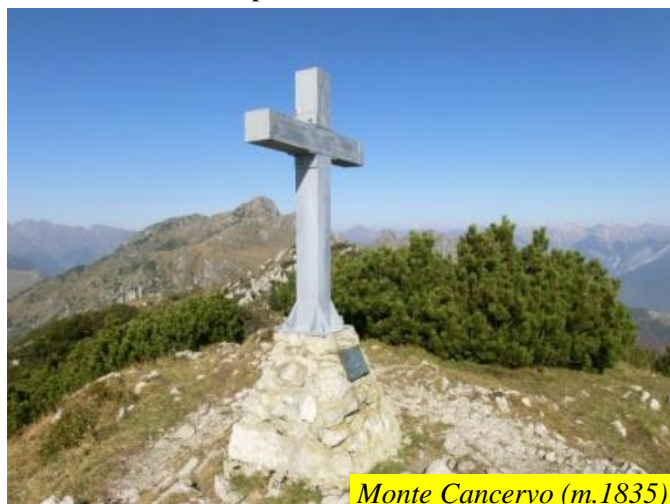
Monte Cancervo (m.1835)

Non resta che godersi lo spettacolare panorama prima del rientro che avviene facendo ritorno al passo di Grialeggio per poi scendere a sinistra percorrendo il sentiero CAI n. 136 fino in località La Foppetta (q. 1075 m); sbucati nella strada asfaltata, la si percorre verso destra in direzione della località Pianca finì al luogo da cui siamo partiti.