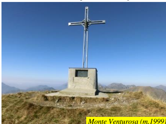
Monte Venturosa (m.1999)