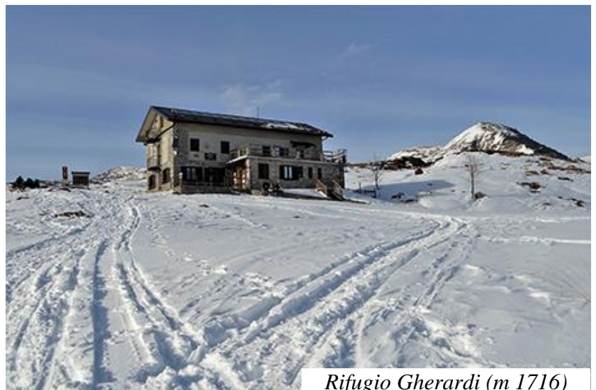
Rifugio Gherardi (m 1716)

Si ignora il primo bivio a sinistra, che conduce alla Baita Parafulmine, e si prosegue sulla strada principale. Anche ai successivi due bivi per il passo Baciamenti, si continua sulla strada, che ora scende rapidamente, fino a raggiungere il parcheggio.