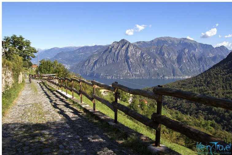
Da Fonteno la vista sul Lago d'Iseo, Corna Trentapassi e Monte Guglielmo

Si prosegue la discesa sulla strada, che diventa lastricata, tralasciando alcune deviazioni, e si raggiunge il Santello, una piccola chiesetta alpestre. Da qui inizia via Campello, che, in pochi minuti, ci riporta al punto di partenza.