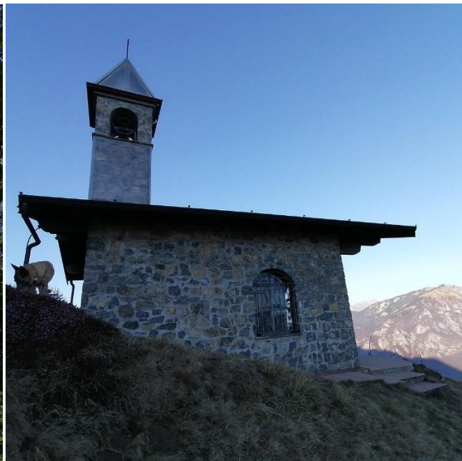
Chiesetta Madonna della Sessa