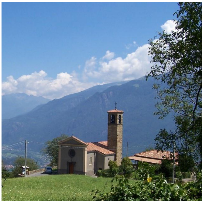
Anfurro, Chiesa dei Santi Nazario e Celso