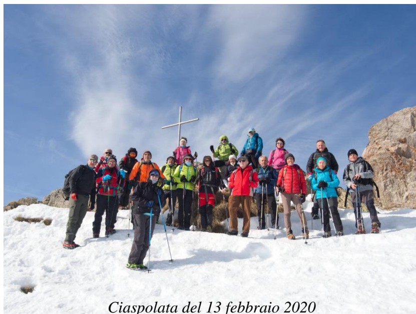
Ciaspolata del 13 febbraio 2020

Il ritorno seguiremo a ritroso il percorso fatto a salire.