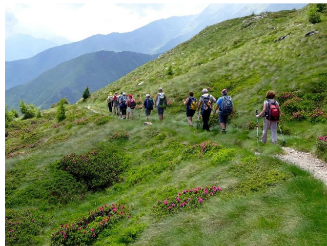
escursione estiva del 7 luglio 2016