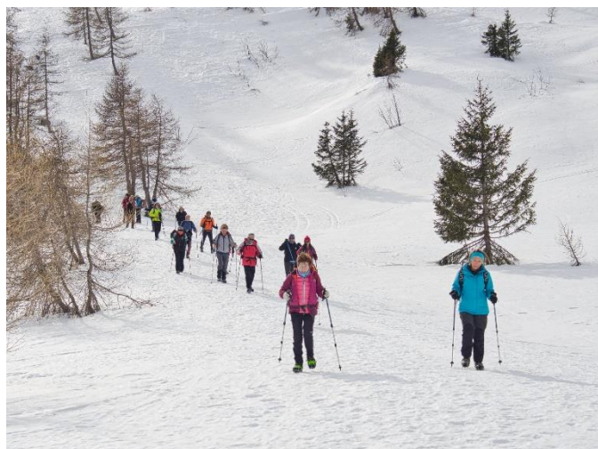
escursione invernale del 13 febbraio 2020