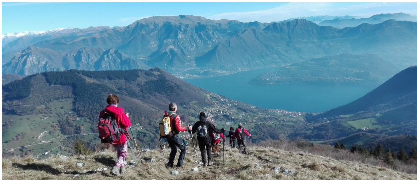
Escursione 10 novembre 2016 - La discesa verso Vigolo

cascina "Case Vecchie" che si imbecca a sinistra. Si prosegue, quindi, fino ad incontrare la strada che porta alla "Cascina Pirù", da qui si svolta a destra per raggiungere la suggestiva Valle delle Tombe . Restando sulla dx della valle si raggiunge direttamente il Ponte Parmerano (m 552) dove si riprende il giro ufficiale con il sentiero 701 che ci riporta a Vigolo.