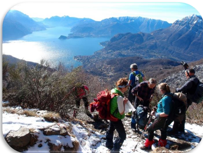
Escursione del gruppo del 8 marzo 2018

Si riparte alle spalle della cappella risalendo l'ampia dorsale erbosa chiamata Costone del Bregagno. La camminata è facile ed allietata dagli infiniti panorami che la circondano. In circa mezz'ora si raggiunge la cima del Monte Bregagnino (m.1905) e proseguiamo in quota lungo il costone del Bregagno sino all'ultimo tratto, un poco più ripido, che permette di raggiungere la vetta del monte Bregagno (m.2107).