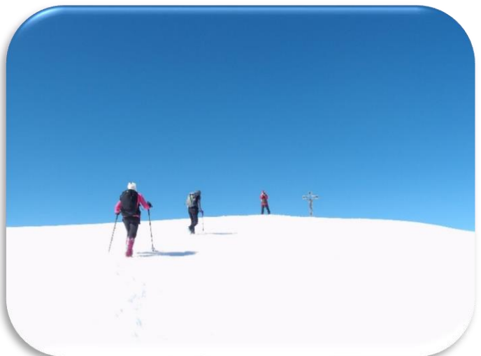
In vista della Croce del Monte Bregagno (m2107)