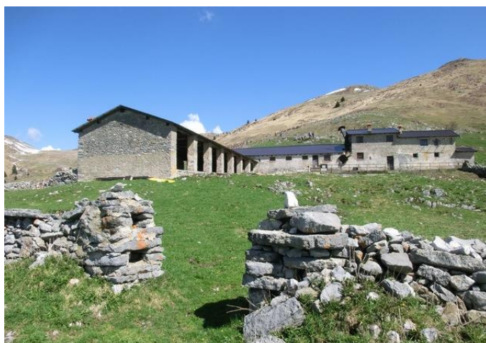
Malga Stalletti Bassa

Dopo una ventina di minuti di cammino il percorso si congiunge nuovamente con la carrabile in prossimità del Rifugio Malpensata (m 1340). Proseguendo è possibile ancora con il sentiero 3V tagliare l'ultimo lungo tornante e raggiungere in breve il nostro parcheggio alla Croce di Marone.