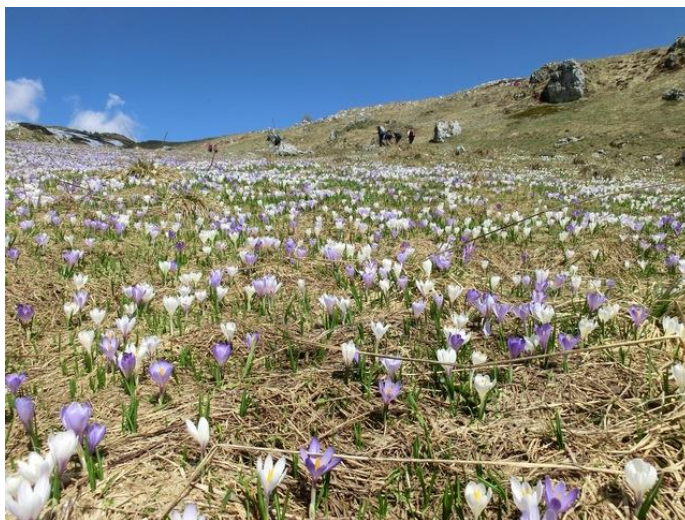
Fioritura di Crocus tra le Malghe Stalletti alta e bassa

Dopo aver percorso una serie di tornanti si raggiunge la Malga Guglielmo di Sopra (m 1750) Sempre su strada si procede verso la malga successiva transitando in un ambiente oggi particolarmente selvaggio e rilassante. In vista nei pressi della Malga Guglielmo di Sotto (m 1575) si può abbandonare la carrareccia principale per