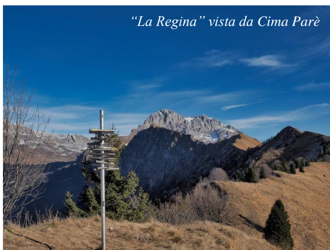
"La Regina" vista da Cima Parè