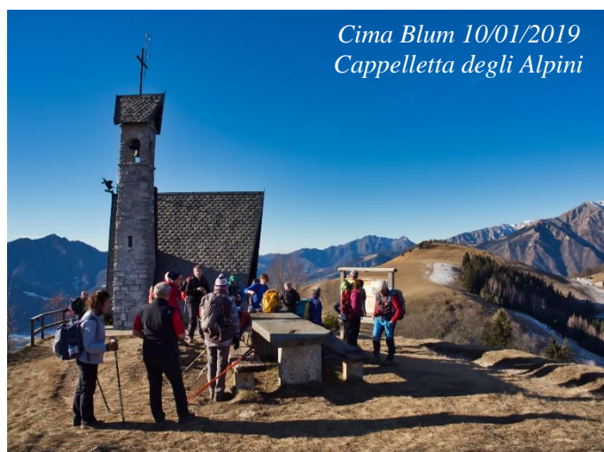
Cima Blum 10/01/2019 Cappelletta degli Alpini