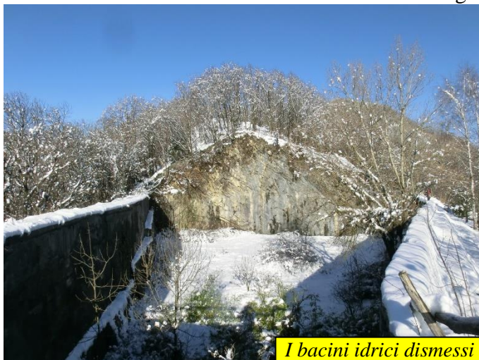
I bacini idrici dismessi

associata a Carpini e Roverelle. Si raggiunge così una postazione di caccia e, subito dopo, lo sterrato di servizio alle cave che si percorre in salita. Evitata una deviazione sulla sx e raggiunto uno spiazzo si prosegue per il sentiero che sale sulla dx, mentre il panorama si apre ora sulla Valle del Giongo e le pendici del Canto Alto. La salita, diventa meno regolare, alterna tratti pianeggianti a tratti più ripidi. Raggiunto un bivio (segnavia poco visibile) si lascia il sentiero che prosegue diritto in piano e si piega decisamente a sx