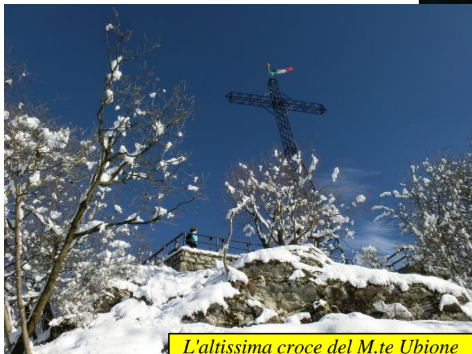
L'altissima croce del M.te Ubione

compiendo un tornante e cambiando decisamente direzione. Al bivio successivo si prosegue dritti, salendo fino a trovare una biforcazione segnalata dove si tiene a dx rimanendo in cresta e seguendo le indicazioni per il Bacino Pizzo (segnavia CAI). La salita, in bosco fitto, diviene più impegnativa e faticosa fino alle costruzioni abbandonate in prossimità del bacino artificiale ormai in disuso. Dopo una sosta per ammirare il panorama che si offre, si prosegue in piano costeggiando i muri dei bacini e, superato il bosco ingentilito da notevoli esemplari di