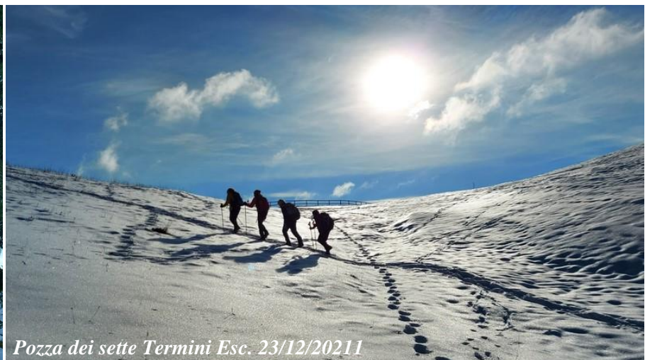
Pozza dei sette Termini Esc. 23/12/2021