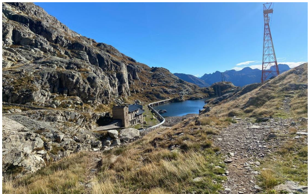
Veduta su Capanna Lago Nero (m 1945) salendo alla diga.

Ritorno: dalla diga del lago Nero (2013 m) sovrastante l'omonimo rifugio, sulla sinistra del sentiero 268 si stacca (sud) il sentiero 267, che prosegue per un primo tratto in piano fino alla val d'Aviasco. Da qui sale per un breve tratto, poi scende ai pascoli della Baita Corna (1943 m) e, con alcuni saliscendi, attraversa il versante est del Pizzo Salina per raggiungere i prati della Costa di Corna Rossa (1780 m), ove si trova - dal 2011 - la bianca statua di una Madonna con Bambino, sveltante sul paese di Valgoglio. Curvando a dx si entra ora nella Val Sanguigno, perdendo quota con un percorso a mezzacosta e, passando dalla Baita Salina di Mezzo (1595 m), si raggiunge il fondovalle a quota 1400 m circa, ove si incrociano il sentiero 265 che conduce in Valcanale nonché il sentiero 232. Con percorso comune a quest'ultimo si scende per la val Sanguigno fino alla centrale di Aviasco (ENEL), a quota 970 m.