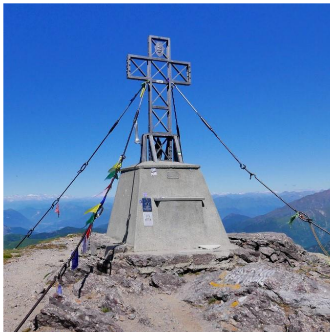
Croce del Pizzo dei Tre Signori (m 2553)