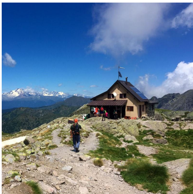
Rifugio Benigni (m 2222)

2° giorno: Salire alla cima di Valpianella 2349, quindi scendere al Passo Bocca di Trona 2324. Questo è l'unico tratto poco segnalato, è però evitabile prendendo subito dal rifugio il "sentiero delle Orobie occ." 101, i due itinerari si incontrano al passo Bocca di Trona. Proseguire sul sentiero 101 fino ad incontrare l'indicazione "pizzo dei Tre Signori", questo sentiero permette di raggiungere la Bocchetta d'Inferno 2306 senza perdere troppa quota. Dalla bocchetta salire alla vetta seguendo le numerose tacche. Discesa per la valle dell'Inferno con sentiero 106. Disliv.tot. in salita 600 m, in discesa 1900. Ore tot. 6 ~.