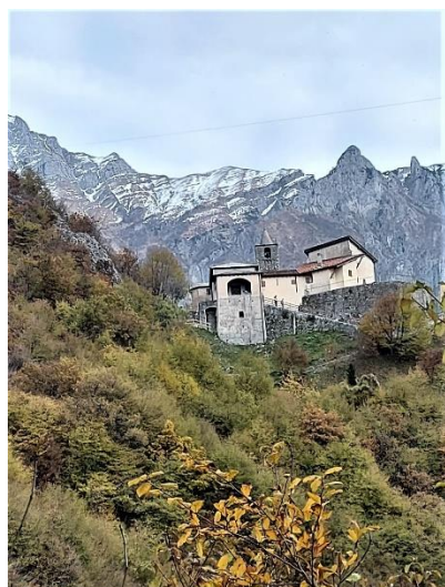
Santuario di S. Maria dell'Olcio

Sulla strada del ritorno è d'obbligo una breve sosta presso il suggestivo Santuario di Santa Maria dell'Olcio un ex convento benedettino abbarbicato su uno sperone roccioso che si staglia in mezzo alle montagne offrendo bellissimi panorami e una splendida vista del lago di Lecco e di Mandello.