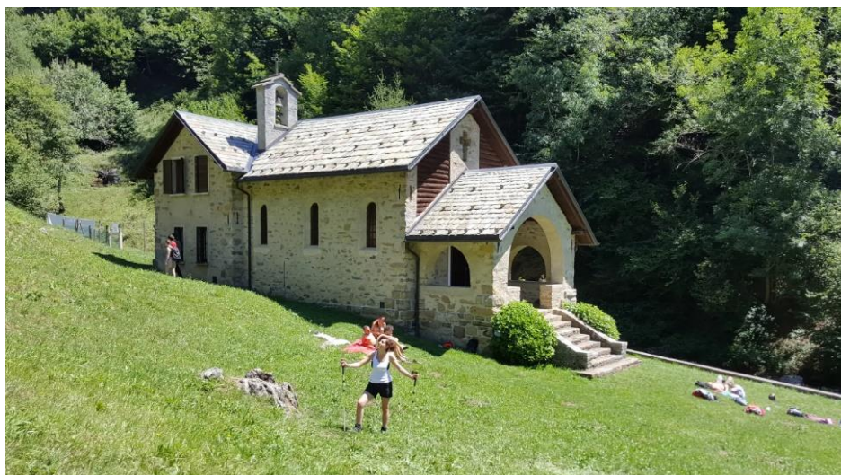
Chiesetta dell'alpe d'Era (m 832)