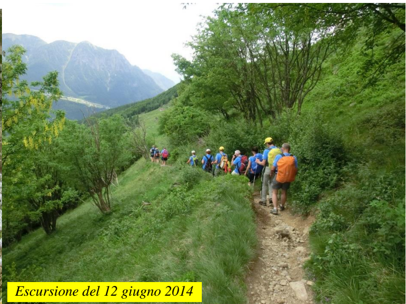
Escursione del 12 giugno 2014