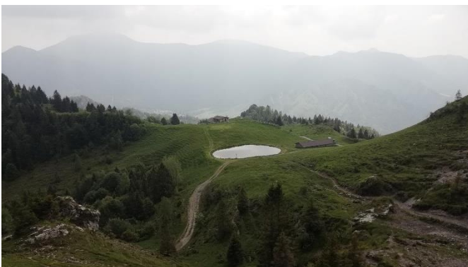
Malga di Campo "La via del latte"