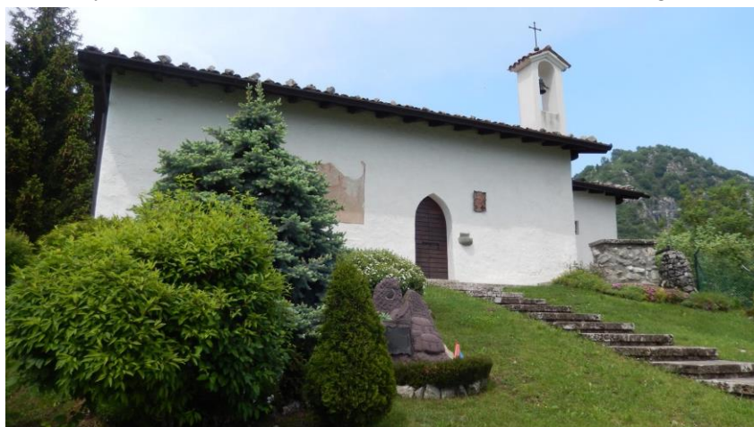
Valle dei molini - Chiesetta di San Pedèr

Se in orario sulla tabella di marcia, varrebbe la pena fargli una visita, è un edificio religioso eretto nel XIV secolo ed è considerato il più antico del territorio, restaurato nel 1974 dagli alpini, conserva al suo interno alcuni bellissimi affreschi che raffigurano illustri santi intenti in preghiera. La Chiesetta è inoltre in una posizione molto panoramica con alle spalle il massiccio della Presolana.