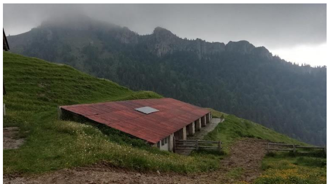
Malga della Presolana "La via del latte"