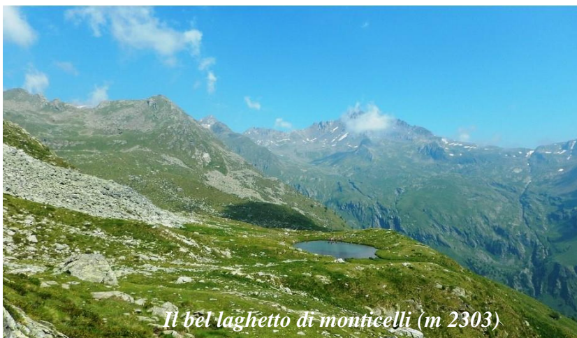
Il bel laghetto di monticelli (m 2303)

In circa 10 minuti dalla deviazione, sempre su bel sentiero, si raggiunge il laghetto di quota 2424 e successivamente quello di quota 2462, dai quali il panorama verso la Presanella e le montagne adamelline è impareggiabile. Ancora un poco di salita e si arriva al punto più alto di tutta l'escursione, circa 2520 metri dove, ai piedi delle impervie pareti dei Corni di Monticelli e delle Piramidi di Somalbosco, sono adagiati altri piccoli specchi d'acqua, talvolta asciutti o quasi. Da qui si hanno buone probabilità di vedere le aquile sorvolare le alte cime che dividono la Valle delle Messi dalla Valle di Canè. Il percorso, dopo aver lambito un altro piccolo laghetto, molto velocemente scende a riprendere il Sentiero CAI 164, un poco più avanti di quando lo si era lasciato e dove, ancora una volta, ci conforta la puntuale segnaletica. Il sentiero continua, perdendo quota, sino a raggiungere in pochi minuti il bel Laghetto di quota 2306, situato su un bel pianoro dal quale la vista può spaziare verso il Gavia e la Valle di Savoretta. Dopo aver attraversato