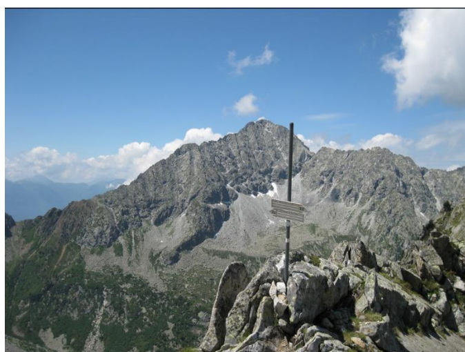
Passo delle Plate (m 2530)