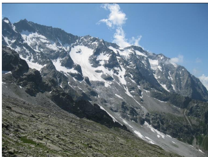
Corno Baitone (m 3331)