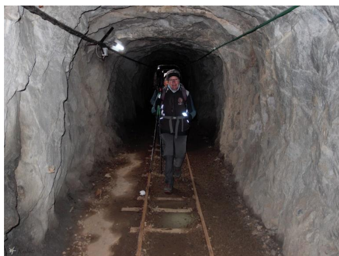
Una delle tante gallerie attraversate dal sentiero