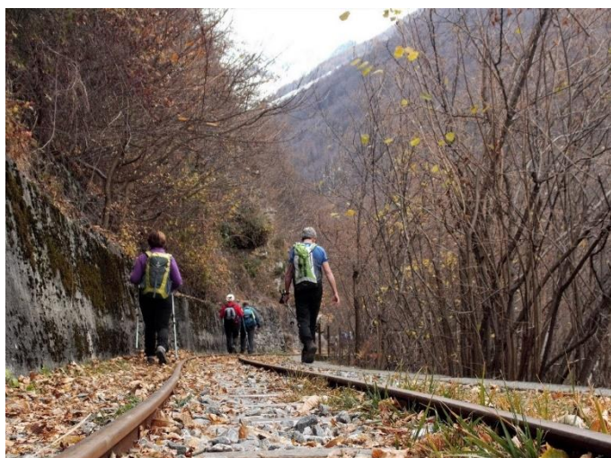
Il sentiero del Tracciolino quota media 920 m s.l.m.