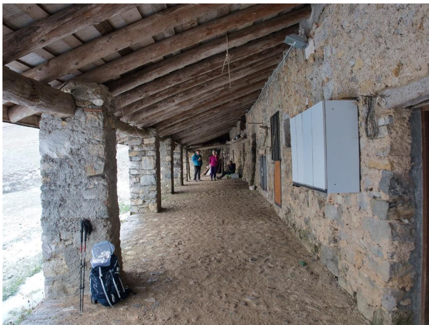
Baita della Forcella (m.1720) escursione del 26 novembre 2021

Un bel giro, specie nella parte più alta, forse meno conosciuta.