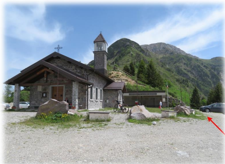
Giogo di Maniva – Chiesetta Regina della pace

Transitati poco sotto il modesto promontorio della Cima Ovest, arriviamo a una sella ricoperta da fitti pini mughì, a sinistra un cartello indica il Sentiero Fiamme Verdi Giacomo Perlasca che scende per Casinello di Paio, continuiamo aggirando un macigno roccioso dietro il quale risale la direttissima