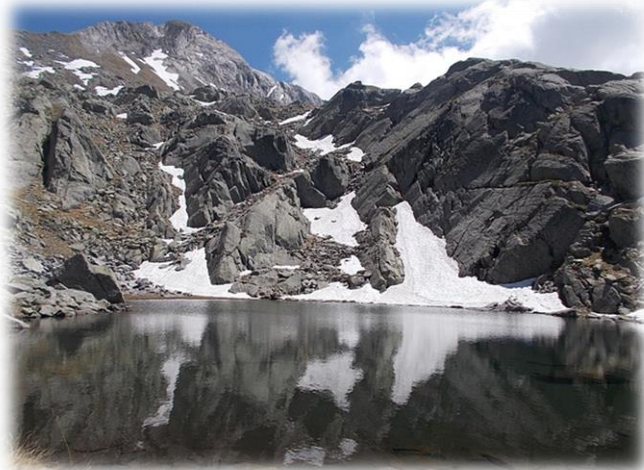
Laghetto di Sorba (m.2337) 1