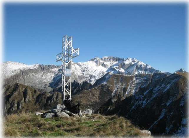
Croce del Monte Alta Guardia (m.2226)

raggiunge la colonia estiva di Pian di Campo, oltre la quale diventa sentiero (detto anche delle mondole), che con minimo dislivello ed aggirando le pendici del Monte Trabucco, va ad immettersi sulla mulattiera che sale da Pian d'Astrio. Con quest'ultima si sale verso la Valle di Stabio e ignorata la deviazione per il Monte Trabucco (sentiero Irene gatti), si supera la M.lga Stabio di sotto (m 1813) e si raggiungono i pascoli della M.lga Stabio di sopra (m 1958), dove la strada finisce. Si segue quindi il sentiero che all'inizio del pascolo devia sulla sinistra e scende verso il bel torrentello e una volta superatolo prima di un caratteristico dosso roccioso, seguendo con attenzione i segnavia, si comincia a risalire il ripido costone prativo verso nord e verso il P.sso del Sabbione di Croce, posto a 2179 metri sul suggestivo e particolare crinale, che delimita a nord-ovest la bella valle di Stabio, oltre il quale ripidi costoni precipitano sul territorio di Niardo. Dal valico è notevole la visuale che si ha sulla Valle di Stabio compresa la parte alta dove sono ben visibili le Porte di Stabio e l'impervio crinale che va fino al Frerone. Si continua ora verso sud-ovest, seguendo il sentiero che all'inizio è abbastanza evidente ma che poi si perde in labili tracce tra l'isiga, ma ciò