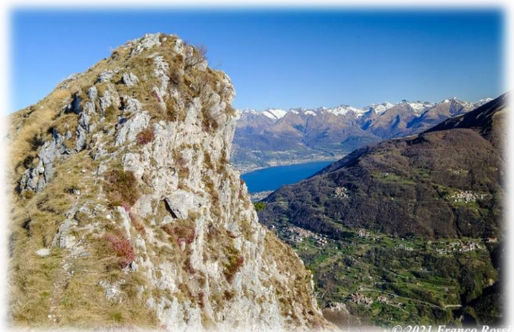
Cima di Daas (m. 1509)

Non tralasciamo di attraversare il paese ed ammirare i dipinti con le storie di Lasco il bandito della Valsassina.