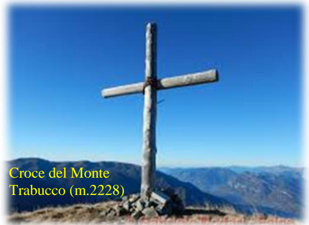
Croce del Monte Trabucco (m.2228)