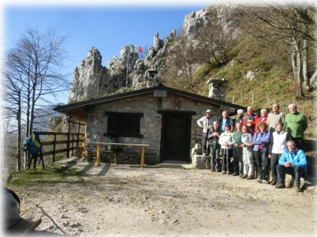
Bivacco Testa Escursione del 30 ottobre 2014