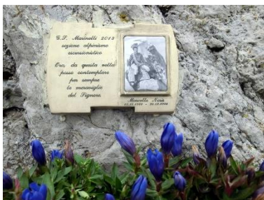
Escursione del gruppo il 7 giugno 2018

Ritorno: ridiscesi al passo dei Campelli si imbecca il sentiero CAI 530 per la val Vertova. Qui a inizio la parte più spettacolare del percorso, torrioni e Pinnacoli ci accompagnano fino alla ripida discesa che ci porta con un'ultimo tratto pianeggiante al Bivacco Testa (m.1474). Lasciato il Bivacco, si imbecca il sentiero CAI 527 che scende sulla destra in un ripido canalino verso la conca di Sedernel (m.1240) e si innesta poi nel sentiero CAI 519 nei pressi della Baita Rondi. Dalla conca di Sedernel si segue il sentiero CAI 519 in direzione di Aviatico e si raggiunge in mezzora circa il passo di Barbata dove a ritroso riprendiamo lo stesso sentiero fatto in salita per raggiungere Costa Serina.