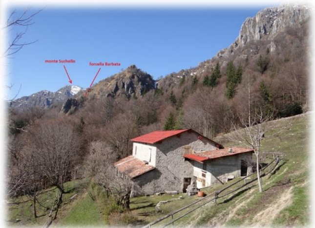
Conca di Sedernel Dietro la seconda Baita parte il sent. per la barbata