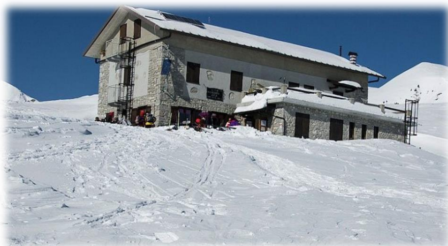
Rifugio Gherardi (m. 1647)