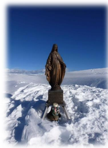
Madonnina del Pizzo Baciamenti (m. 2009)