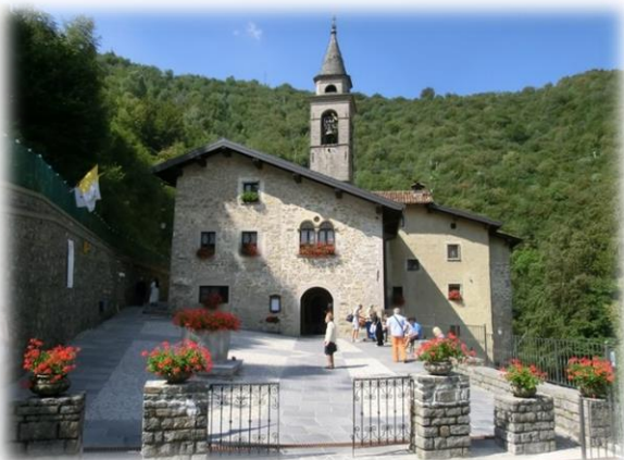
Santuario Madonna del Perello

Si raggiunge la S.P Nembro-Selvino e la si percorre per ½ km in direzione di Nembro sino alla cava di pietrisco che si attraversa per immettersi sul sentiero CAI 535. Da qui il sentiero prosegue, percorrendo le pendici sud-orientali del Monte Podona e, dopo aver oltrepassato un vallone boscoso, giunge prima alla sorgente della Corna Tagliata, ed in breve al Colle del Forcellino. Da qui si percorre a ritroso lo stesso sentiero dell'andata per raggiungere Lonno.