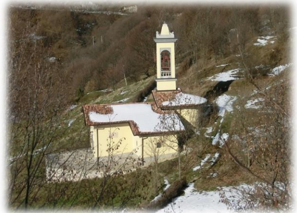
Salmezza - Chiesetta di San Barnaba

in seguito il sentiero si fa più dolce entrando in un bosco. Passiamo accanto ad un traliccio e risalendo un'altra zona rocciosa giungiamo alla grande croce della Cima Sud 1192m (Cima Rasgada). Da qui inizia il tratto più impegnativo dell'escursione, proseguiamo in cresta, inizialmente scendendo attraverso alcuni roccioni, per poi continuare, sempre su terreno roccioso, fino alla Cima Nord 1227m prestando molta attenzione in presenza di neve o ghiaccio. Dalla vetta, su cui è posta una piccola croce, abbiamo una magnifica vista sulle Orobie e sulla sottostante zona di Selvino. Dalla cima è già visibile in direzione Nord il colle di Salmezza (1003 metri), ove sorge l'omonimo abitato con tra l'altro la bella chiesetta di San Barnaba. Bisogna semplicemente percorrere l'agevole cresta Settentrionale del Podona fino a raggiungere il colle, sul quale si dirama a sinistra la strada per il Santuario del Perello proveniente da Selvino.