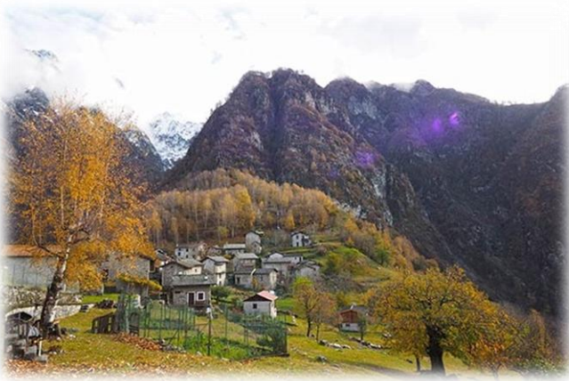
Il piccolo borgo antico di S. Giorgio

Chiavenna, dopo aver visitato la stazione di arrivo di Campo si imbecca una delle più lunghe gallerie, è bene munirsi di pila frontale, l'illuminazione della stessa è temporizzata, inizia adesso il tratto più spettacolare e affascinante del percorso, si susseguono intagli scavati nella roccia, gallerie, attraversamenti, curve a picco su dirupate vallette. Alla fine dell'ultima galleria di fronte ad una grata improvvisamente i binari muoiono, il sentiero prosegue, superando un ultimo spunto roccioso, incrocia il sentiero per San Giorgio, già visibile da prima, 200 metri sotto. Villaggetto costruito su una verde collinetta con al centro la graziosa chiesetta con il suo distaccato campanile. Una volta raggiunto San Giorgio si segue sulla destra il sentiero che in breve precipita su Novate Mezzola, da qui ancora camminando al punto di partenza.