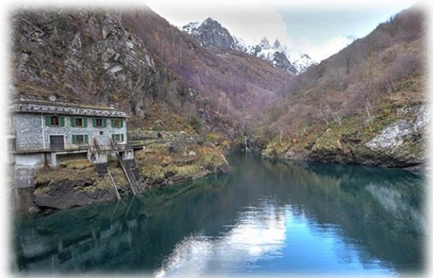
Lago artificiale di Moledana

proseguire nell'imbocco di una delle gallerie, si scendono sul fondovalle alla stessa località. Ancora oggi l'insieme degli impianti è utilizzato. Si parte da Verceia risalendo le case verso la montagna con il lago alle spalle si seguono le indicazioni per la Valle dei Ratti, la strada con numerosi tornanti sale nella valle poi diventa una carrareccia non asfaltata, è preferibile tagliarla seguendo le indicazioni e il sentiero nel bosco di castagni, si arriva ad una piccola spianata con la costruzione di una cappelletta con un affresco di fianco ad una tettoia, area attrezzata dagli Alpini