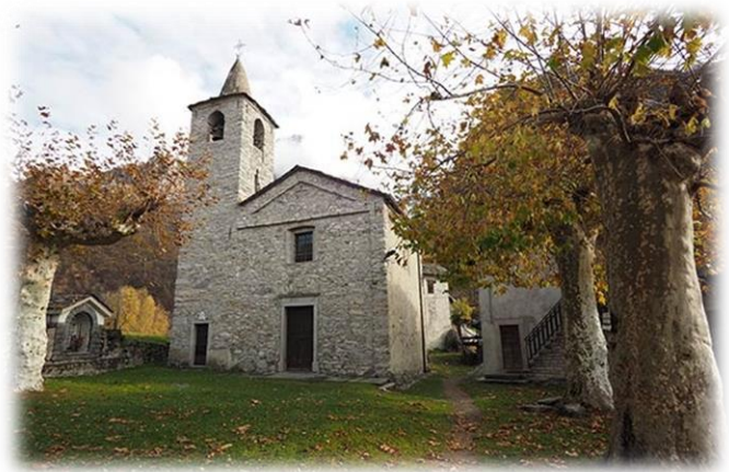
La chiesetta di S. Giorgio

Chiavenna, dopo aver visitato la stazione di arrivo di Campo si imbecca una delle più lunghe gallerie, è bene munirsi di pila frontale, l'illuminazione della stessa è temporizzata, inizia adesso il tratto più spettacolare e affascinante del percorso, si susseguono intagli scavati nella roccia, gallerie, attraversamenti, curve a picco su dirupate vallette. Alla fine dell'ultima galleria di fronte ad una grata improvvisamente i binari muoiono, il sentiero prosegue, superando un ultimo spunto roccioso, incrocia il sentiero per San Giorgio, già visibile da prima, 200 metri sotto. Villaggetto costruito su una verde collinetta con al centro la graziosa chiesetta con il suo distaccato campanile. Una volta raggiunto San Giorgio si segue sulla destra il sentiero che in breve precipita su Novate Mezzola, da qui ancora camminando al punto di partenza.