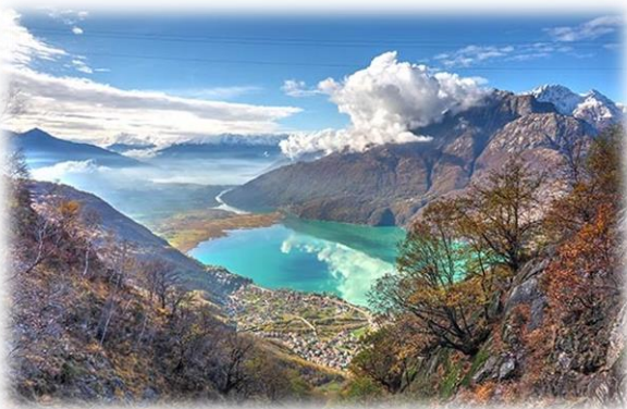
Panorama dalla Val dei Ratti

La parte percorsa, che si ritiene la più interessante, è quel tratto che va da dalla Val dei Ratti al piccolo abitato di San Giorgio. A metà circa del percorso con una piccolissima deviazione prima di raggiungere la stazione di Campo ove le condotte