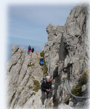
← ↑ Sentiero Cecilia nr.10