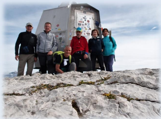
In vetta alla Grigna Meridionale (m.2184)