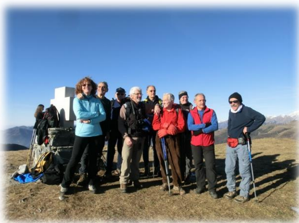
Monte Sparavera (06 gennaio 2015)

Senza raggiungerla, si costeggia stando alti sulla sinistra il pascolo, seguendo i numerosi segnavia sugli alberi, si attraversa nuovamente il bosco e si risale il costone del monte Barzena sino a un rudere. Da qui si prosegue verso la staccionata che circonda la pozza dei Sette Termini (1290 m), dove è collocato il monumento a ricordo del lancio in paracadute del generale Raffaele Cadorna jr, il 12 agosto 1944. Da qui in pochi minuti è possibile raggiungere la vetta dello Sparavera (1369 m) con splendido panorama sul lago di Endine (in caso di nebbia attenzione a non perdere i riferimenti). Proseguendo lungo la carrareccia si arriva al segnavia 547 e poi in circa mezz'ora alla Malga Lunga.