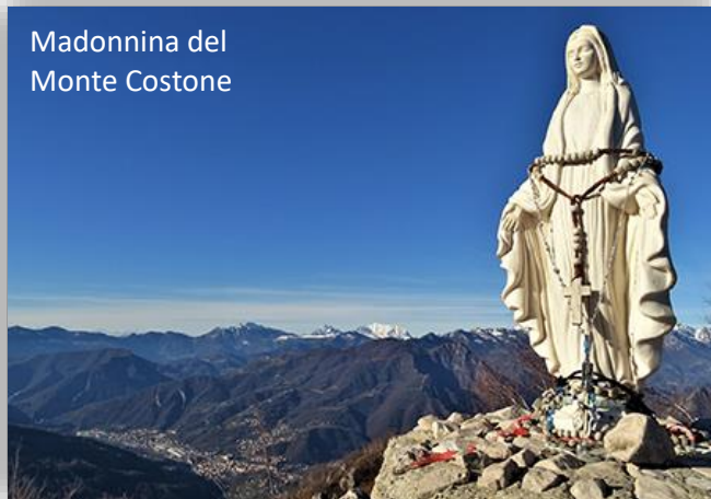
Madonna del Monte Costone