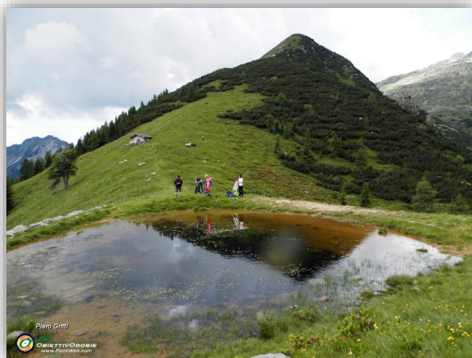
Baita Bassa di Zulino (escursione del 23 ottobre 2014)

Giunti all'incrocio con il sentiero CAI 216 che a destra porta ai laghi Gemelli, pieghiamo a sinistra sino a raggiungere in breve il Rifugio Alpe Corte dal quale, con il classico sentiero CAI 220 facciamo ritorno al nostro parcheggio di Valcanale.