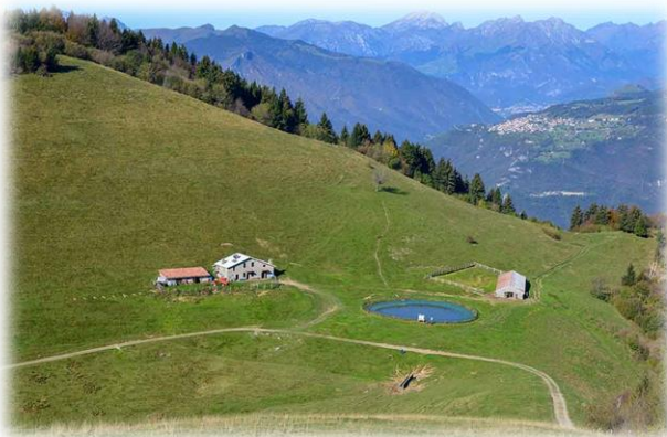
Malga Aguina (m.1180)

NB. La brevità dell'itinerario consente di ricavare del tempo per scoprire il paese di Zone, le Piramidi e le sue chiese che custodiscono preziosi affreschi e opere lignee.