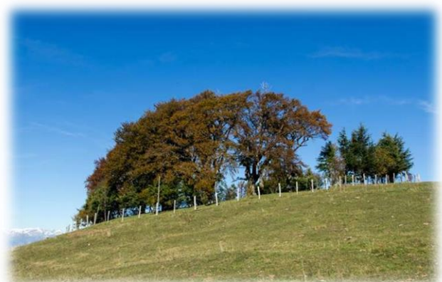
Monte Agolo (m.1366) "Le Tredici Piante"