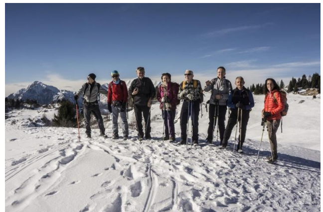
Mappa e immagini, fatte nell'escursione del 18 gennaio 2018