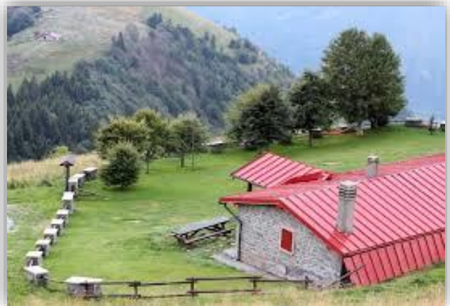
Rifugio Vaccaro (m.1519)