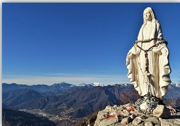
Madonnina del Monte costone (m.1195)