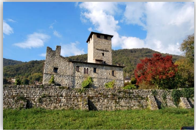
Bianzano - Castello Suardo (XVI secolo)