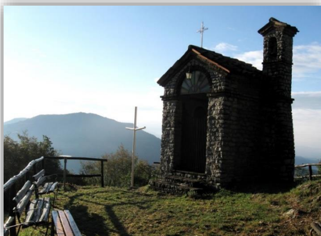
Cappella del Cesulì (m.921)