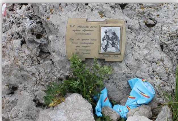
Targa a ricordo di Marcello Noris Collocata dal gruppo il 28/09/2014 ai piedi della croce del M.te Alben